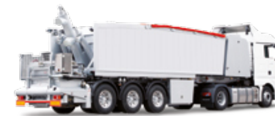
Mixmobile mit CASEA-Bindemittelcompounds sind in der Lage, die Qualität von Fließestrich durch Änderung der Rezepturen auf der Baustelle den jeweiligen Anforderungen anzupassen

Die CASEA-Bindemittelcompounds für die Anwendungsbereiche „Werk trockenmörtel und Zweikammersilos“ berücksichtigen die eingesetzten Rohstofffraktionen des Zuschlags. Zudem können auf Wunsch spezielle Produkteigenschaften durch die Wahl unterschiedlicher Bindemittelzusammensetzungen und Sandsieblinien eingestellt werden.